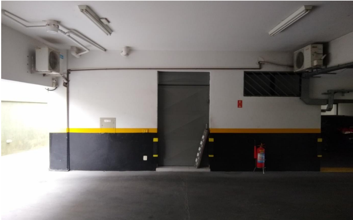
Estacionamento subsolo do prédio