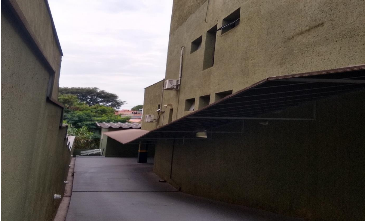
Corredor esquerdo do prédio