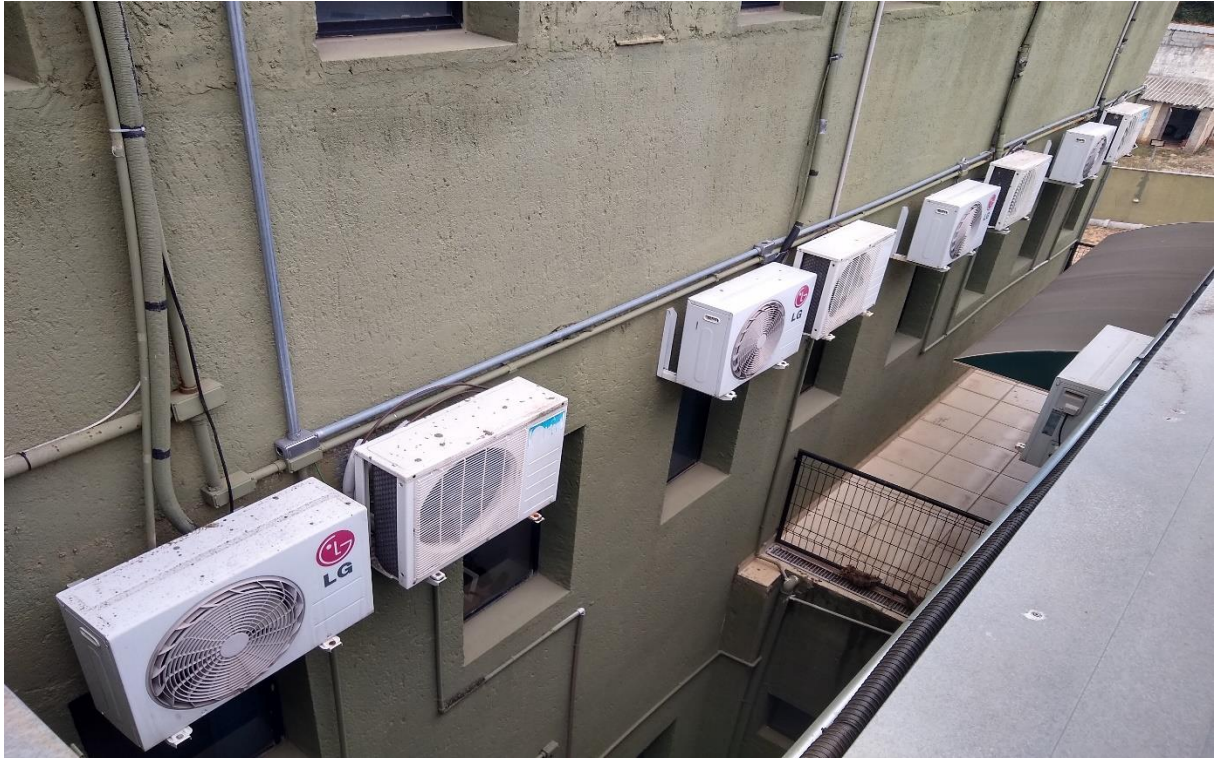
Jardim de inverno prédio (vista superior)