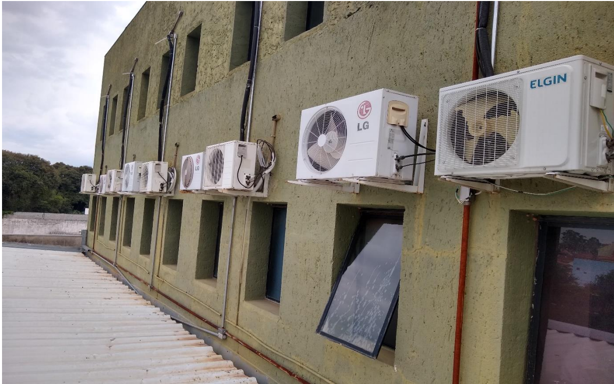
Telhado do legislativo