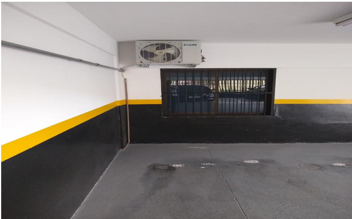
Estacionamento subsolo prédio