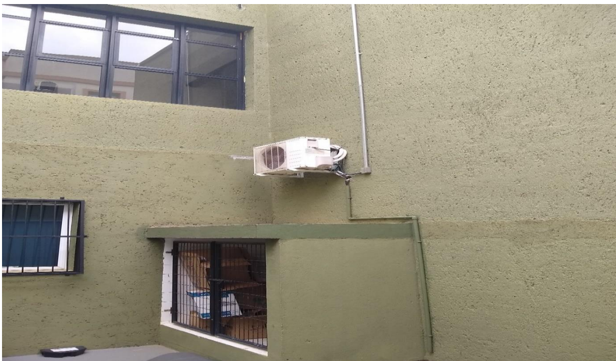
Corredor esquerdo do prédio