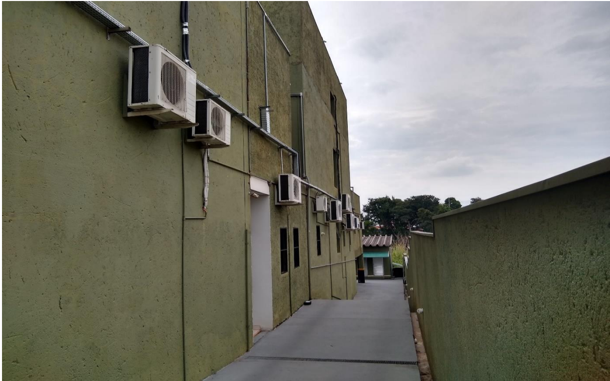
Meio do corredor direito do prédio