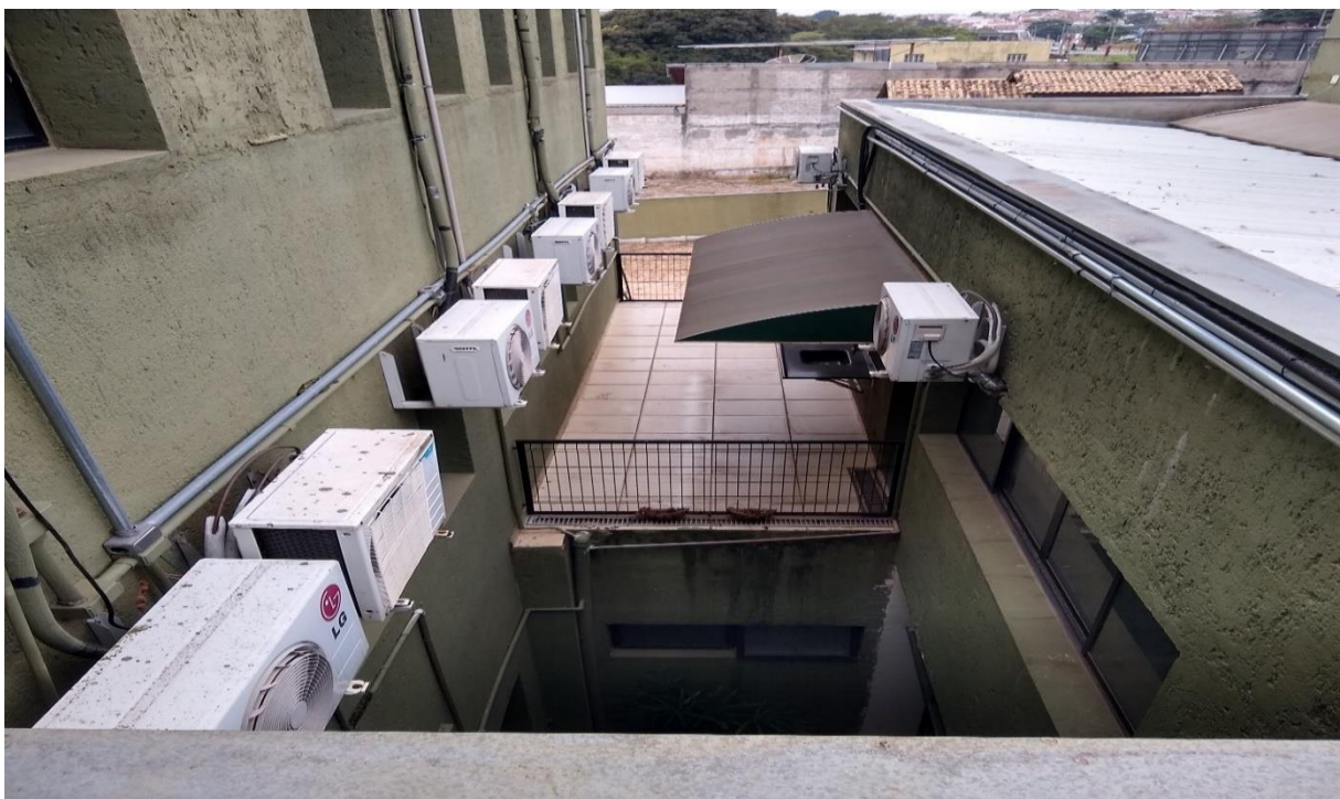
Jardim de inverno prédio (vista superior)