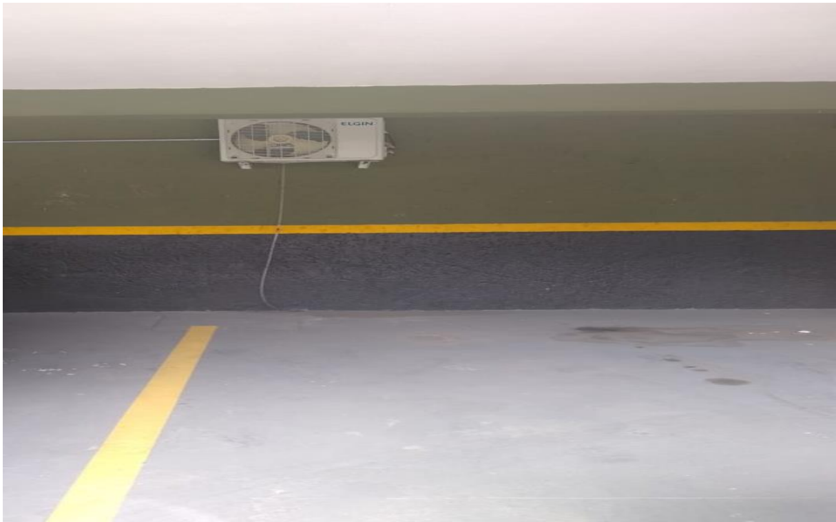
Estacionamento subsolo do prédio