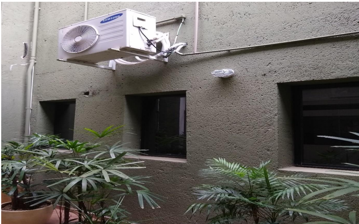
Jardim de inverno prédio