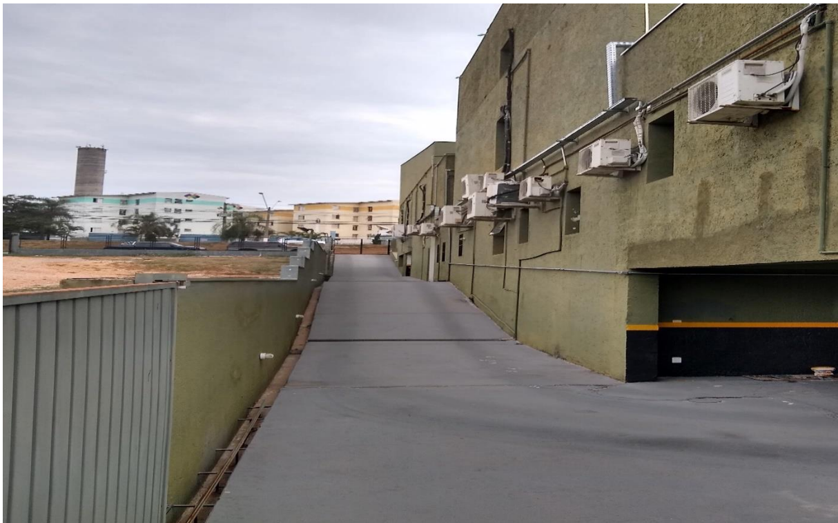
Fim do corredor direito do prédio