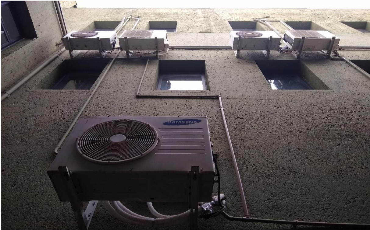
Jardim de inverno prédio ( vista inferior)