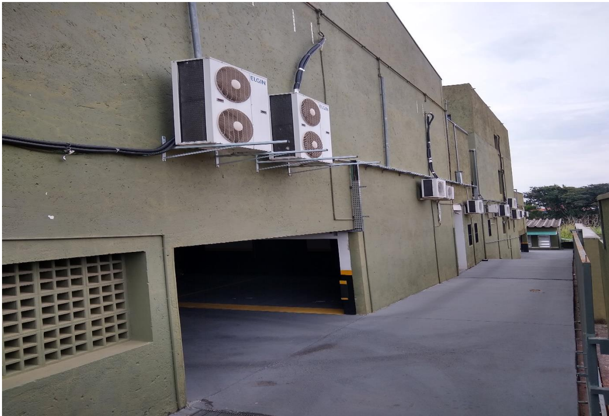
Início do corredor direito do prédio