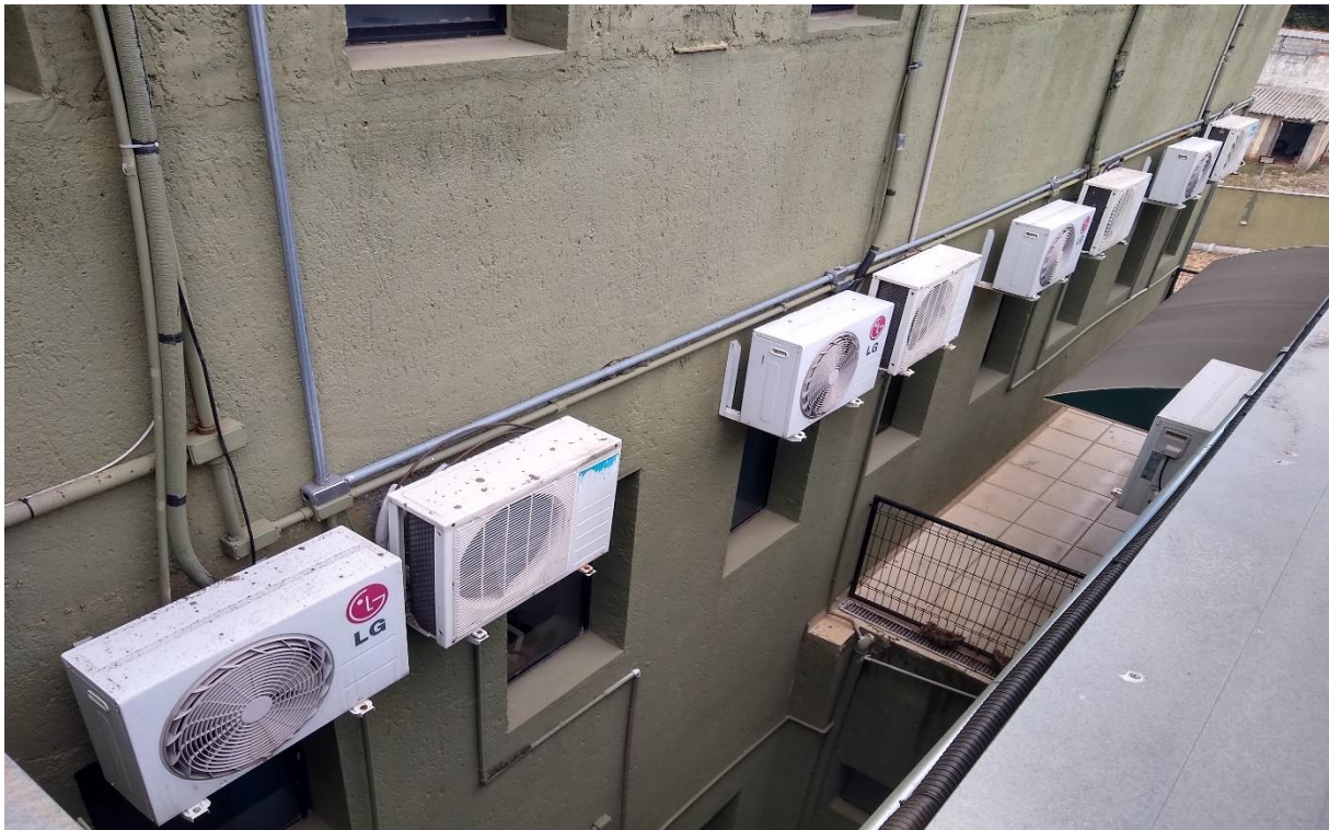
Jardim de inverno prédio (vista superior)