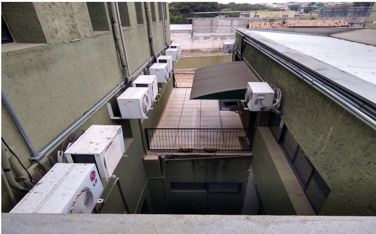
Jardim de inverno prédio (vista superior)