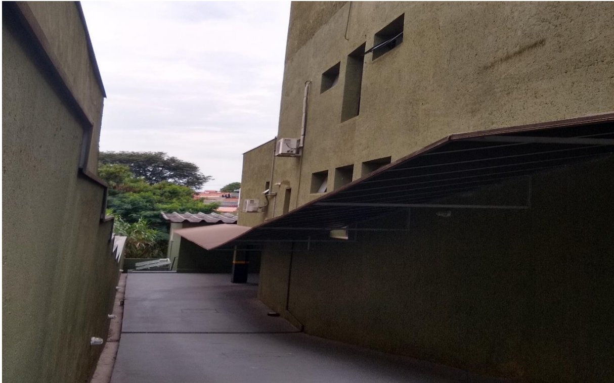
Corredor esquerdo do prédio