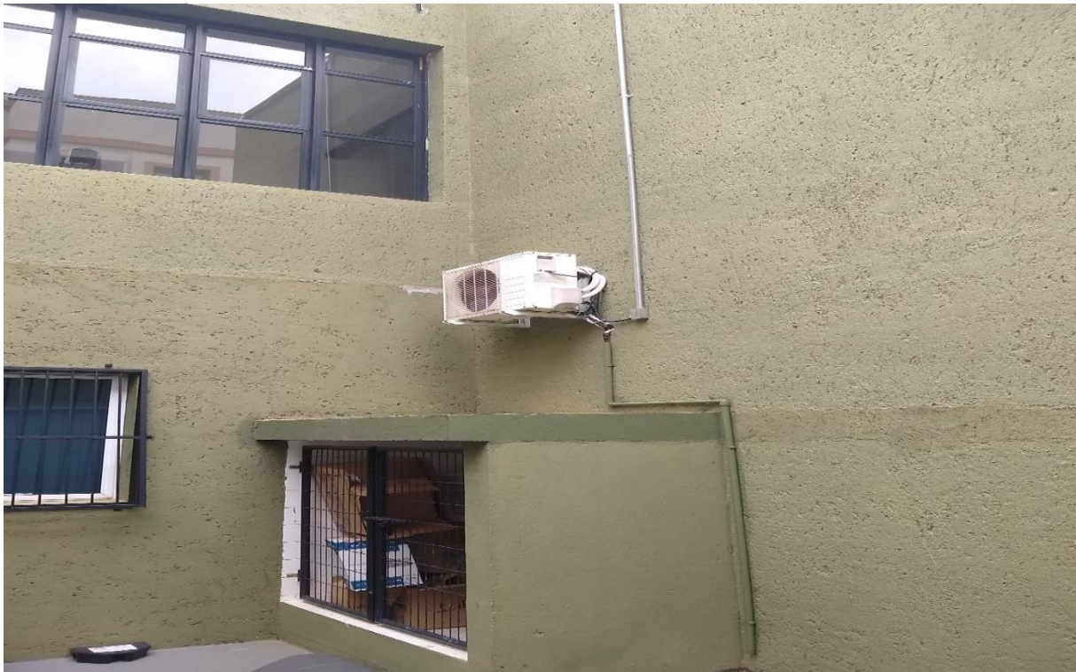
Corredor esquerdo do prédio